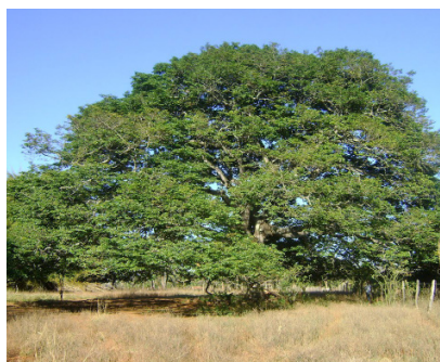
( ) JATOBAZEIRO