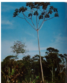
( ) EMBAÚBA

1) Jacaré Cajá disse que não conseguia subir na árvore em que Titaco vivia. Qual das três imagens é árvore de Titaco?